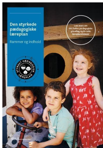
Den styrkede pædagogiske læreplan, Rammer og indhold

Denne skabelon indeholder alle de lovmæssige krav til evalueringen. Lovkravene finder I i de to