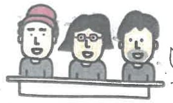
*Foto kan evt. vedhæftes

Vi er typisk to personaler der putter et barn på skift. 3 personale er på stuen med børnene og rydder op efter frokost